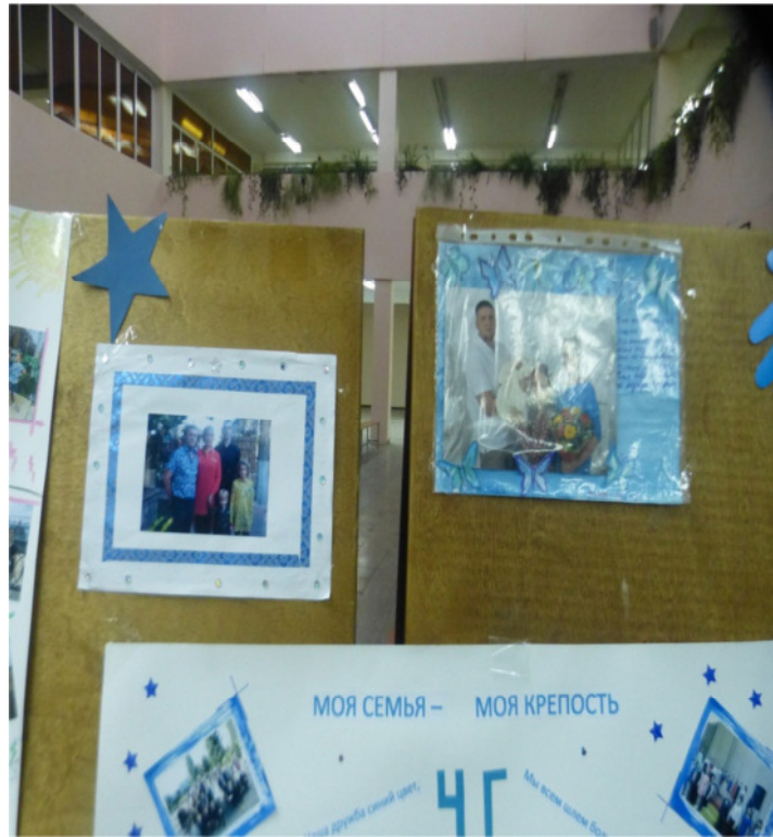
А такие мы были синие.