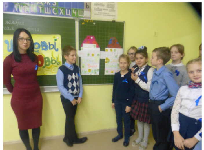
4 «И» класс провел урок «Семья-школа любви»