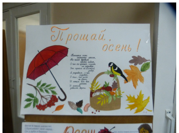
Такими мы были в школе. Все жёлтые-жёлтые