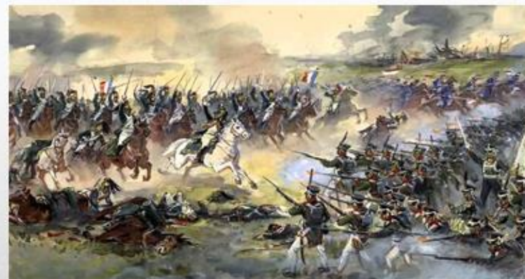
Отечественная война 1812 г.