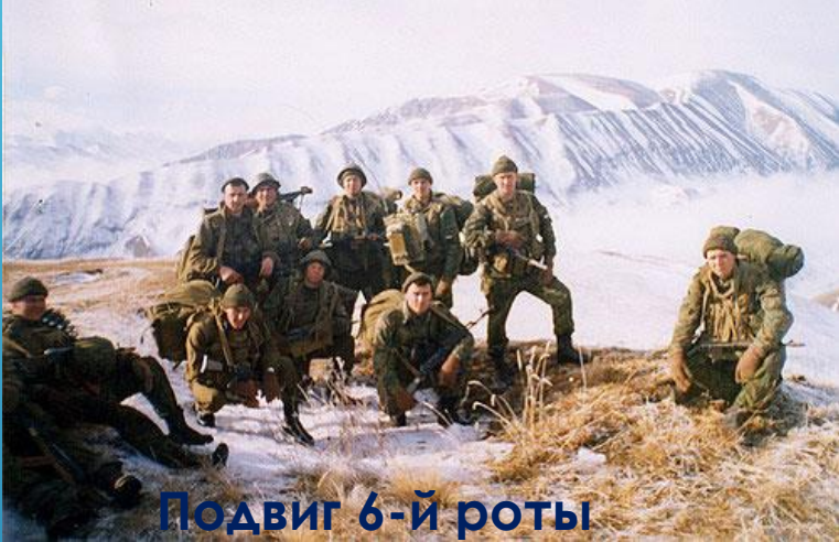
Подвиг 6-й роты псковских десантников