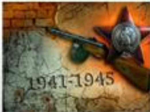
Великая Отечественная война