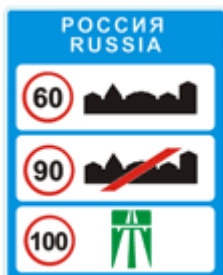
"Общие ограничения максимальной скорости "

Информационные знаки информируют о расположении населенных пунктов и других объектов, а также об установленных или о рекомендуемых режимах движения.