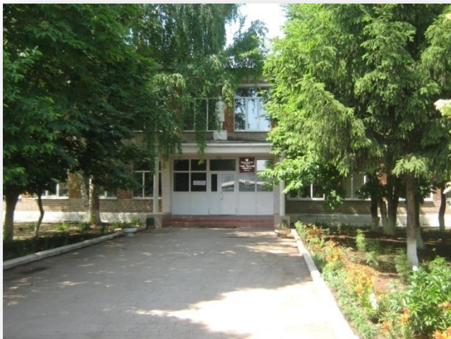
Кинель-Черкасский филиал (имеется общежитие)