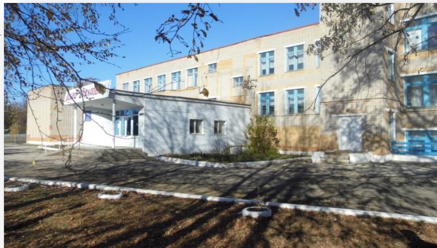
Шенталинский филиал (общежития нет)

Самарская область, Шенталинский район, ст. Шентала